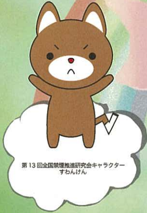
第13回全国禁煙推進研究会キャラクター すわんけん