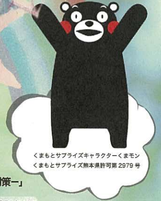
くまもとサプライズキャラクターくまモン くまもとサプライズ熊本県許可第2979号