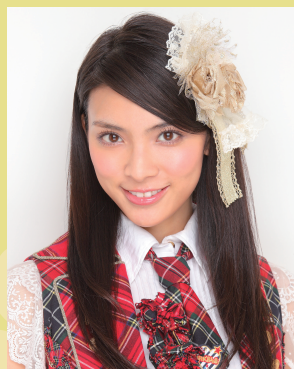
秋元才加 (AKB チーム K)