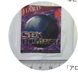
「アロマオイル」 などとして販売