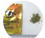
「お香」「ハーブ」 などとして販売

他にも「芳香剤」「バスソルト」「ハーバルインセンス」「ビデオクリーナー」など、見た目を変え繁華街、自動販売機、インターネットなどで売られています。違法薬物が含まれているにも関わらず合法性を謳ったり、有害で危険な薬物が含まれているため、絶対に関わらないようにしてください。