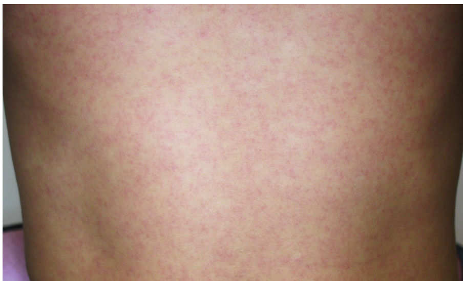
図3. ジカウイルス病の斑状丘疹様の発疹

潜伏期間は、2～12日（多くは2～7日）である。ジカウイルス病の臨床症状は多彩であるが、斑状丘疹様の発疹（ 図3 ）は90～100%に認められるのに対して、発熱の頻度は35～65%とされており 25,45,46 、またこの発疹は掻痒感を伴うことが多いとされている。なお、大半の症例は入院を必要としなかった。 表7 に2015年のブラジル・リオデジャネイロにおけるジカウイルス病患者が発症後4日以内に認めた臨床症状を示す 45 。