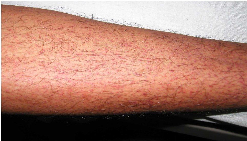
図 1. デング熱患者の発疹：解熱時期にみられた点状出血