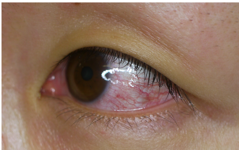
図 4. ジカウイルス病の充血性結膜炎

※ ただし、蚊媒介による国内発生を疑う場合は、1. をおこしうる他の疾患を除外した上で、2. の条件は必須ではない ( 2.1 デング熱②診断「鑑別診断」 を参照)。