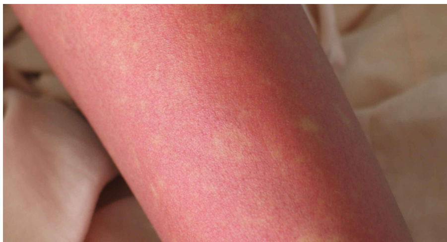
図 2. デング熱患者の発疹：解熱時期にみられた島状に白く抜ける紅斑