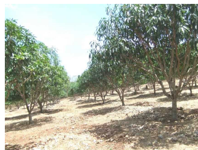
フィリピン産マンゴーの農場

フィリピン産マンゴーについては、残留農薬に係るフィリピン政府の原因究明及び再発防止策を受け、現地調査を実施した。