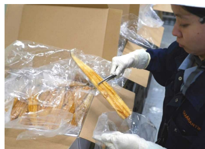
保税倉庫での検体採取

平成27年度は52,211件(計画件数延べ95,090件に対し97,187件(実施率:約102%))を実施し、このうち172件(延べ173件)に法違反が確認され(表2)、回収、廃棄等の措置を講じた。