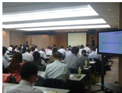
検疫所による説明会

指定外添加物（法第 10 条）について比較すると、輸入時に法違反が判明した違反件数が 42 件、輸入前指導（輸入相談）にて確認した法に適合しなかった相談件数 151 件と輸入前相談（輸入相談）時の方が多かった。このことから、輸入前指導（輸入相談）にて輸入者の自主的な安全管理の推進が図られたことにより、法違反に該当する食品等の輸入が未然に防止されていることが確認された。