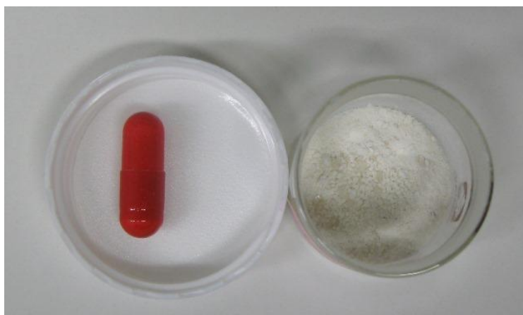
カプセル及び内容物