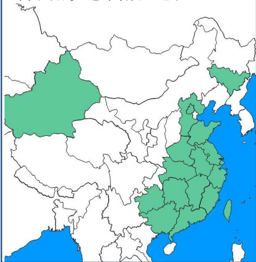
中国・台湾の感染者発生地域