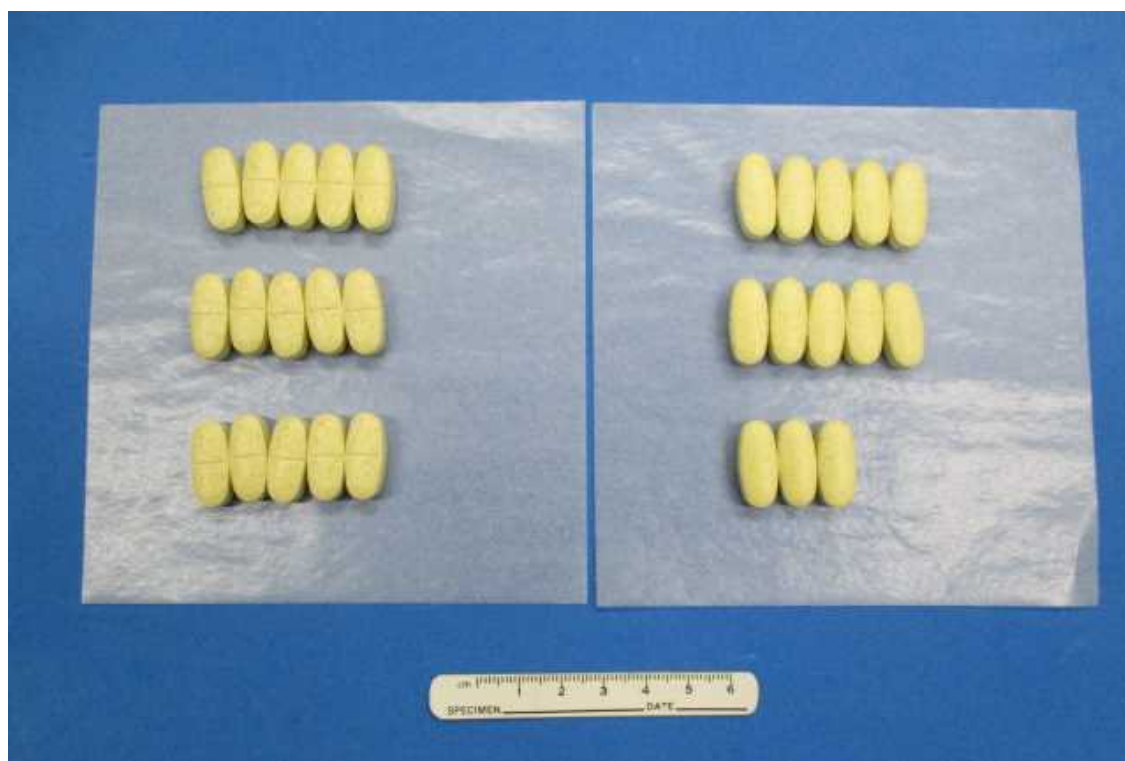
中に入っていた錠剤を薬包紙に並べた様子 (28錠入り)