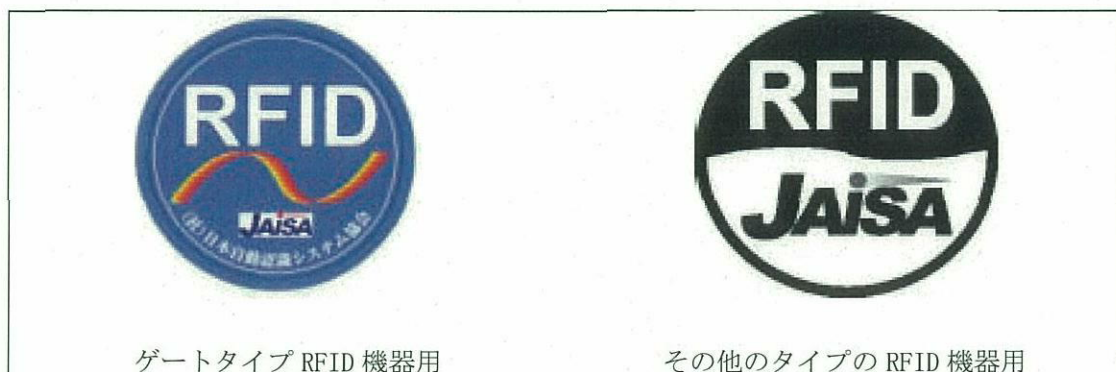
図 1 RFID ステッカ