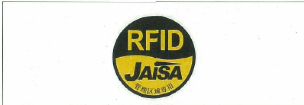
図2 管理区域専用 RFID 機器用ステッカ

注1： ここでは、公共施設や商業区域などの一般環境下で使用される RFID 機器を対象としており、工場内など一般人が入ることができない管理区域でのみ使用される RFID 機器(管理区域専用 RFID 機器)については対象外としている。なお、管理区域専用 RFID 機器については、(社)日本自動認識システム協会において、一般環境への流出を防止するため、取扱説明書等に注意書きを記載するとともに、管理区域専用 RFID 機器用ステッカ(図2)を貼付することとされている。