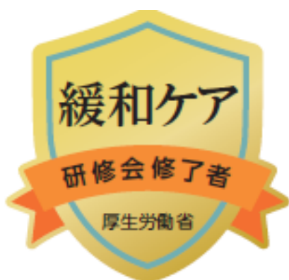
研修会修了者バッジ