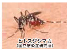
ヒトスジシマカ

ヒトスジシマカは、小さな水たまりを好んで産卵します。日本に広く生息するヒトスジシマカはデング熱、ジカウイルス感染症、チクングニア熱などを媒介します。