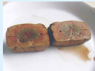
レバー(火が通っていない)