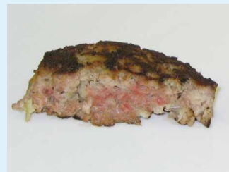
ハンバーグ(火が通っていない)