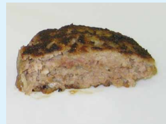
ハンバーグ(火が通っている)