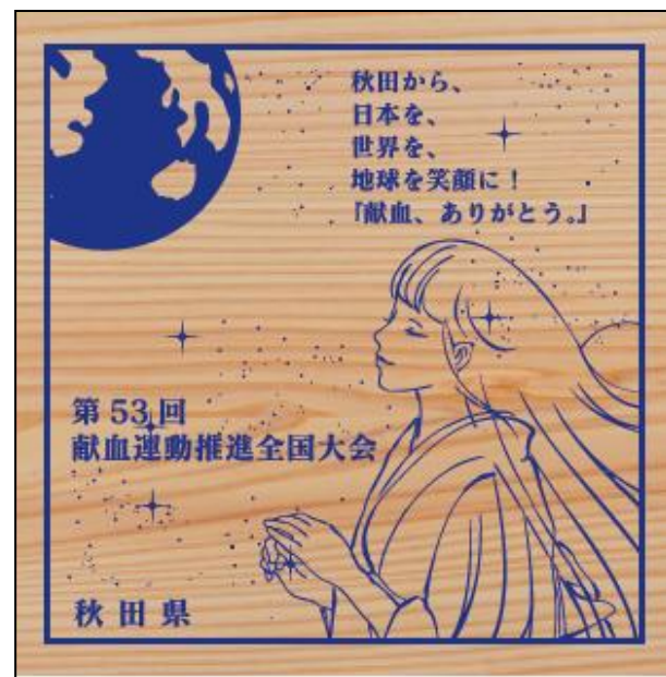
フレグランスボード