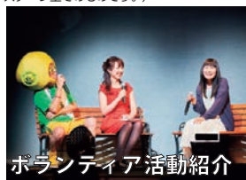
ボランティア活動紹介

小林麻耶さんのご冥福を心よりお祈り申し上げます。 (このコメントは2017年6月6日に行なわれた「LOVE in Action Meeting (LIVE)」のステージ上でのものです。)