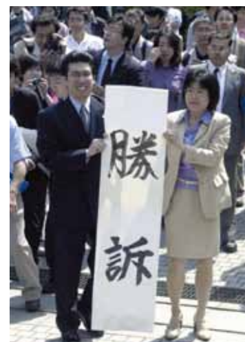
熊本地裁での勝訴発表

太陽は輝いた 90年、長い長い暗闇の中 一筋の光が走った 鮮烈となって 硬い巖を砕き 光が走った 私はうつむかないでいい みんなと光の中を 胸を張って歩ける もう私はうつむかないでいい 太陽は輝いた