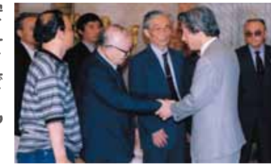
控訴断念するか否かの最終判断をする直前に、ハンセン病訴訟原告代表と面談する小泉内閣総理大臣(当時)

熊本地裁の判決に対し、国は控訴※断念を決めるとともに、内閣総理大臣談話を発表し、ハンセン病問題の早期解決に取り組む決意を表明しました。しかし判決後も、熊本県で入所者に対するホテル宿泊拒否事件が起きるなど、残念ながら入所者や社会復帰者、その家族に対する偏見や差別には根強いものがあります。そのため、療養所の外で暮らすことに不安を感じ、安心して退所することができないという人もいます。