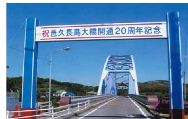
人間回復の橋と呼ばれる邑久長島大橋

長島と対岸の虫明を結ぶ邑久長島大橋は、1988年(昭和63年)に開通しました。隔離する必要のない証、人間回復の証として架橋され、現在は民間バスも乗り入れ、入所者も自由に島外に出かけられるようになっています。