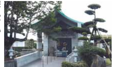
星塚敬愛園の納骨堂

高齢や後遺症、周囲の偏見などを乗り越えて、療養所を退所して社会復帰した人もいますが、その数は決して多いとはいえません。療養所に入所したときに、家族に迷惑が及ぶことを心配して本名や戸籍を捨てた人もいるため、現在も故郷に帰ることなく、肉親との再会が果たせない人もいます。療養所で亡くなった人の遺骨の多くが実家のお墓に入れず、各療養所内の納骨堂に納められています。