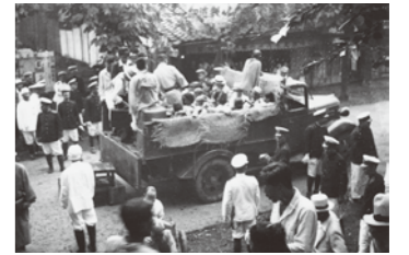
患者の収容には警察官が立ち会った

19世紀後半、ハンセン病はコレラやペストなどと同じような恐ろしい伝染病であると考えられていました。当初は、家を出て各地を放浪する患者が施設に収容されましたが、やがて自宅で療養する患者も収容されるようになりました。ハンセン病と診断されると、市町村や療養所の職員、医師らが警察官を伴ってたびたび患者のもとを訪れました。そのうち近所に知られるようになり、家族も偏見や差別の対象にされることがあったため、患者は自ら療養所に行くより仕方ない状況に追い込まれていったのです。このような状況のもとで、昭和6年(1931年)にすべての患者の隔離を目指した「癩予防法」が成立し、療養所の増床が行われ、各地にも新しく療養所が建設されて行きました。また、各県では「無癩県運動」という名のもとに、患者を見つけ出し療養所に送り込む施策が行われました。保健所の職員が患者の自宅を徹底的に消毒し、人里離れた場所に作られた療養所に送られていくという光景が、人々の心の中にハンセン病は恐ろしいというイメージを植え付け、それが偏見や差別を助長していったのです。