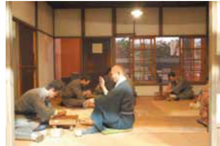
昔の療養所の暮らしが再現されています

全国のハンセン病療養所や国内外の関係機関から収集した資料が数多く展示されています。ハンセン病に関する約30,000冊の図書を収蔵した図書閲覧室もあります。