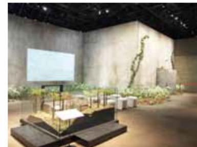
縮尺1/20の模型(手前)と実寸大で部分再現された重監房

また、ガイダンス映像や証言ビデオなどの映像が見られるほか、歴史パネルや実物資料を展示したコーナーなどがあります。