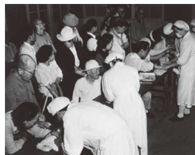
治療薬「プロミン」の注射

ハンセン病患者の隔離政策は、「癩予防法」という法律のもとで進められました。昭和28年(1953年)、患者の反対を押し切ってこの法律を引きつぐ「らい予防法」が成立しました。この法律の問題点は、患者隔離が継続され、退所規定が設けられていないことでした。つまり、ハンセン病患者は療養所に収容されると、一生そこから出ることが出来なかったのです。昭和21年にハンセン病の特効薬「プロミン」が登場し、その後、新しい飲み薬タイプの治療薬が開発され、ハンセン病は適切な治療をすれば治る病気になっていました。にもかかわらず、患者の強制収容が続けられたのです。昭和30年前後から徐々に規制が緩和され、病気が治って自主的に退所する人たちも出てきました。しかし彼らは療養所に入所する際に、社会や家族と断絶させられており、療養所の外では頼る人はなく、救いの手を差し伸べる人も、受け皿もなかったのです。そのような状況の中で、生活苦で体を壊したり、病気を再発させたりして、やむなく療養所に戻る人も少なくありませんでした。