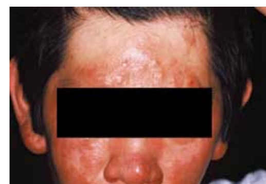
多菌型の患者。浮腫性で光沢のある紅斑で、一部には結節(しこり)が見られる。この結節部分を検査すると、らい菌を検出できる。