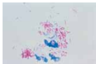
らい菌(赤く棒状のもの、皮膚の検査、1,000倍拡大)

一般的な環境では非常にうつりにくい病気です。感染源となる可能性があるのは未治療のハンセン病患者ですが、日本では感染源になる人はほとんどいません。患者と結婚した人が発症することも非常に少ないと考えられています。感染経路に関する見解は現在も統一されていませんが、発症に大きく関与する感染の機会として、まだ抵抗性の発達が不十分な乳幼児期に、感染源となる未治療の患者と長い間一緒に生活したりすると、鼻腔粘膜などから感染(主に呼吸器感染)して、数年から数十年の潜伏期を経て発症する可能性があるといわれています。