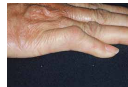
小指に軽度の変形がみられる患者。