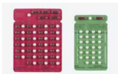
ハンセン病の治療薬

抗生物質を内服します。リファンピシン(結核の治療にも使われている殺菌力の強い薬)、DDS(スルホン薬)、クロファジミン(色素剤)の3種類の抗生物質を併用します(多剤併用療法)。この治療を行うと、短期間でらい菌は感染力を失います。ハンセン病は治る病気ですが、早期診断、早期治療、治療薬の確実な内服を心がけ、後遺症を残さず、耐性菌を作らないようにすることが大切です。らい菌が多い(多菌型)患者は1年から数年、らい菌の少ない(少菌型)患者は6カ月の内服で治癒します。