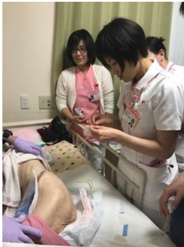
陰圧閉鎖療法の実習