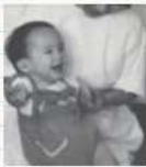
※写真は、ご本人が幼少時のものです。

ことはないと知っています。力強く生きることでも苦難を乗り越えるしかないのです。このサリドマイドが、現在、再び認可され使われています。多発性骨髄腫という血液のがんやハンセン病の症状に効果があることが分かったためです。薬そのものが悪いのではない—二度と同じような被害を起こさないために、この薬の危険性をよく知って、慎重に使用してほしいと思います。