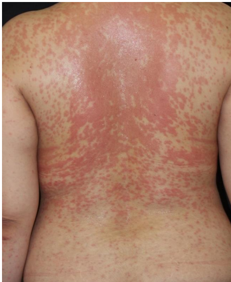
図1 多形紅斑（セレコキシブによる薬疹）