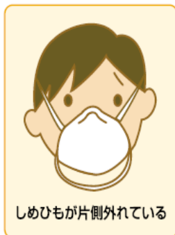
しめひもが片側外れている