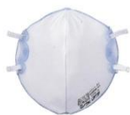
使い捨て式防じんマスク※ ※ 国家検定合格品を使用してください。