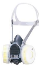
取替え式防じんマスク※