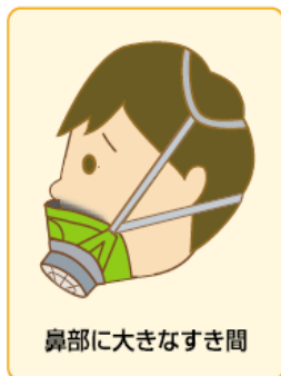
鼻部に大きなすき間