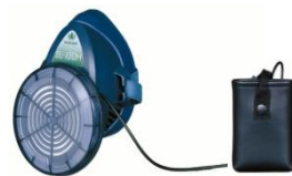
電動ファン付き呼吸用保護具※