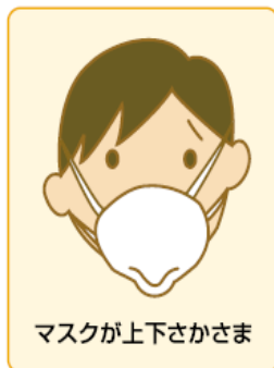
マスクが上下さかさま