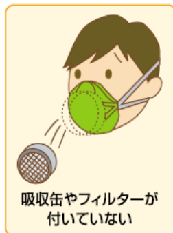
吸収缶やフィルターが 付いていない