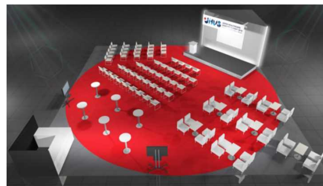
↓ プレゼンテーションエリア イメージ