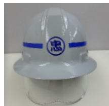
保護メガネ付き ヘルメット