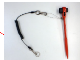
落下防止ワイヤー