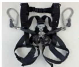
フルハーネス型 墜落制止用器具