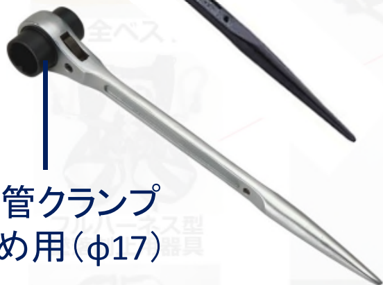
単管クランプ 締め用(φ17)