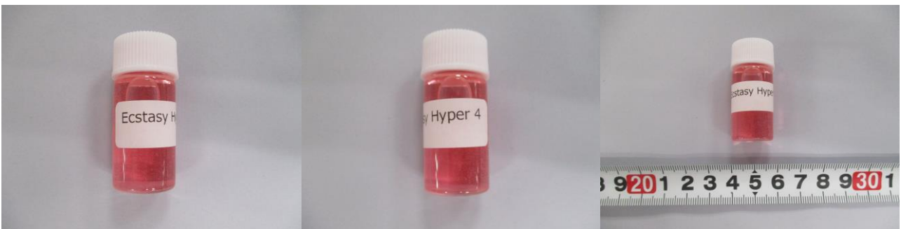
表示名称：Ecstasy Hyper4 形状：ビン入り赤色液体