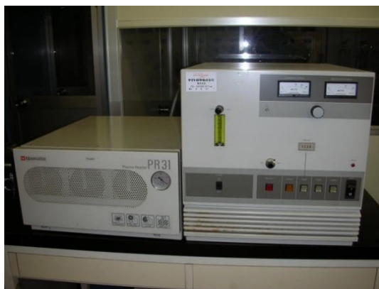
写真 2 低温灰化処理装置の例

捕集面を下にして、フィルタをスライドガラス上に載せ、低温灰化処理を行う。この作業を行うことによって有機質繊維を除去することができ、エリオナイトを含む無機質繊維（他の人造鉱物繊維も含む）として、計数分析することが可能になる。写真 2 に低温灰化処理装置の例を示す。