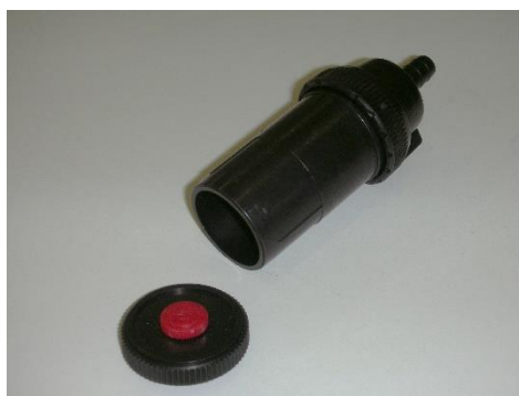
写真1 カウル付ホルダーの例 (25mm \phi のろ紙装着用)

フィルタホルダーは、カウル付のオープンフェース型ホルダーを用いる。写真1にカウル付ホルダーの写真を示す。