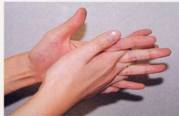
4. 指の間を十分に洗う