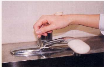
7. 水道の栓を止めるときは、手首か肘で止める。できないときは、ペーパータオルを使用して止める