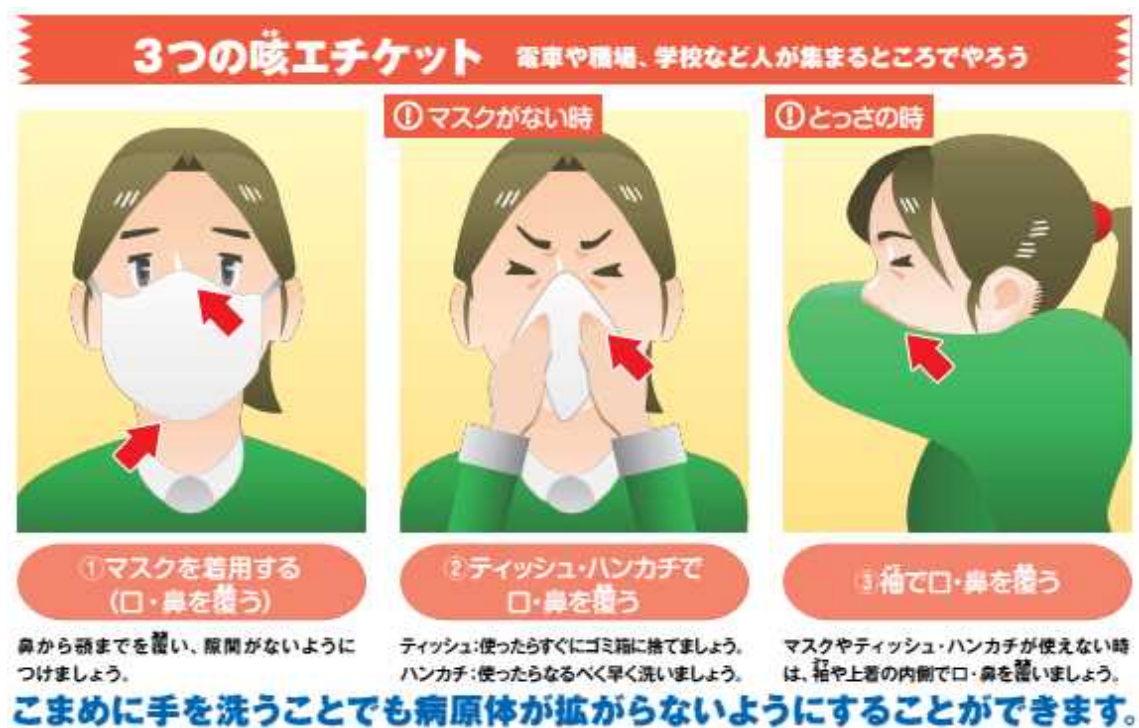
図3 咳エチケットについて