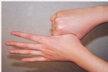
5. 親指と手掌をねじり洗いする