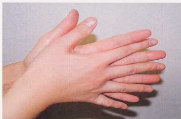
1. 手のひらを合わせ、よく洗う