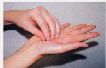
3. 指先、爪の間をよく洗う