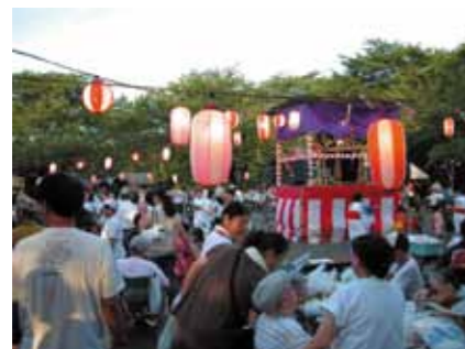
地域の人たちと交流会(多磨全生園)

私たちがこうした現実を知らなかったのは、国が国民に実態を知らせなかっただけでなく、私たちの無関心も大きな原因なのではないでしょうか。子どもたちにハンセン病問題の現実を伝え、今なお偏見や差別に苦しんでいる入所者や社会復帰者たちが置かれている現実を目を向けてほしいと思います。さらに、ハンセン病問題の解決をめざして、私たちに何が出来るかを子どもたちと共に考え、行動にうつしていただければと願っています。