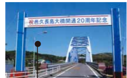
人間回復の橋と呼ばれる久島長島大橋

長島と対岸の虫明を結ぶ久島長島大橋は、1988年(昭和63年)に開通しました。隔離する必要のない証、人間回復の証として架橋され、現在は民間バスも乗り入れ、入所者も自由に島外に出かけられるようになっています。