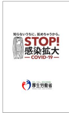
②上記画面が立ち上がる(※)