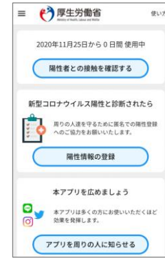
③アプリホーム画面が表示される

※②が表示されずに③が表示される場合、アプリを強制終了してください。強制終了の方法はメーカー、機種によって異なりますが、主な方法として以下があります。