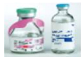
特殊免疫グロブリン製剤による治療