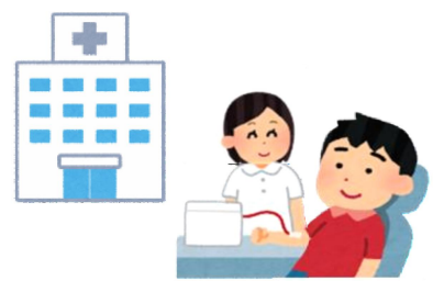
抗体保有者からの採血等