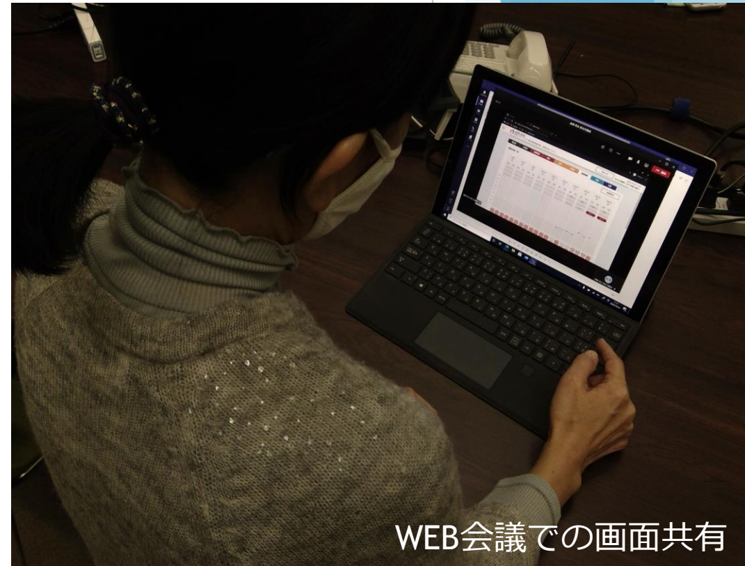
WEB会議での画面共有