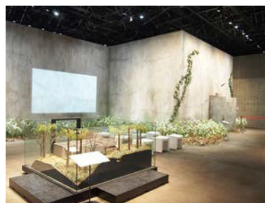
縮尺1/20の模型(手前)と実寸大で部分再現された重監房

〒377-1711 群馬県吾妻郡草津町草津白根464-1533 電話 0279-88-1550 URL https://www.nhdm.jp/sjpm/