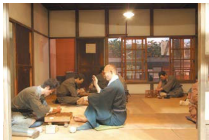
昔の療養所の暮らしが再現されています

〒189-0002 東京都東村山市青葉町4-1-13 電話 042-396-2909 URL https://www.nhdm.jp/