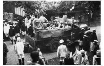
患者の収容には警察官が立ち会った

19世紀後半、ハンセン病はコレラやペストなどと同じような恐ろしい伝染病であると考えられていました。当初は、家を出て各地を放浪する患者が施設に収容されましたが、やがて自宅で療養する患者も収容されるようになりました。ハンセン病と診断されると、市町村や療養所の職員、医師らが警察官を伴ってたびたび患者のもとを訪れました。そのうち近所に知られるようになり、家族も偏見や差別の対象にされることがあったため、患者は自ら療養所に行くしかない状況に追い込まれていったのです。このような状況のもとで、昭和6年(1931年)にすべての患者の隔離を目指した「癩予防法」が成立し、療養所の増床が行われ、各地にも新しく療養所が建設されていきました。また、各県では「無癩県運動」という名のもとに、患者を見つけ出し療養所に送り込む施策が行われました。保健所の職員が患者の自宅を徹底的に消毒し、人里離れた場所に作られた療養所に送られていくという光景が、人々の心の中にハンセン病は恐ろしいというイメージを植え付け、それが偏見や差別を助長していったのです。