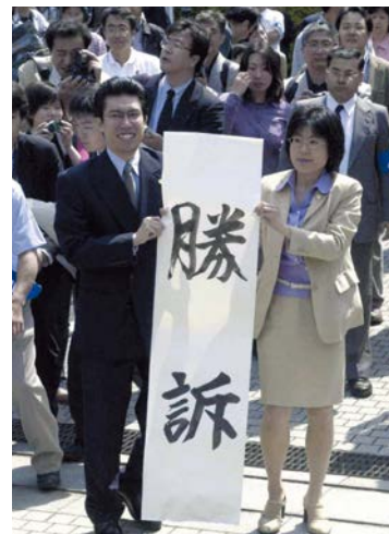
熊本地裁での勝訴発表

熊本地裁判決の日に 原告が勝訴の感動を綴った詩 太陽は輝いた 90年、長い長い暗闇の中 一筋の光が走った 鮮烈となって 硬い殻を砕き 光が走った 私はうつむかないでいい みんなと光の中を 胸を張って歩ける もう私はうつむかないでいい 太陽は輝いた