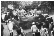
患者の収容には警察官が立ち会った

19世紀後半、ハンセン病はコレラやペストなどと同じような恐ろしい伝染病であると考えられていました。当初は、家を出て各地を放浪する患者が施設に収容されましたが、やがて自宅療養する患者も収容されるようになりました。ハンセン病と診断されると、市町村や療養所の職員、医師らが警察官を伴ってたびたび患者のもとを訪れました。そのうち近所に知られるようになり、家族も偏見や差別の対象にされることがあったため、患者は自ら療養所に行くしかない状況に追い込まれていったのです。このような状況のもとで、昭和6年(1931年)にすべての患者の隔離を目指した「癩予防法」が成立し、療養所の増床が行われ、各地にも新しく療養所が建設されていきました。また、各県では「無癩県運動」という名のもとに、患者を見つけ出し療養所に送り込む施策が行われました。保健所の職員が患者の自宅を徹底的に消毒し、人里離れた場所に作られた療養所に送られていくという光景が、人々の心の中にハンセン病は恐ろしいというイメージを植え付け、それが偏見や差別を助長していったのです。