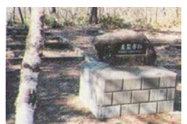
特別病室(重監房)跡/栗生楽泉園

療養所の所長には、療養所内の秩序確立のために、裁判を行わずに患者を処罰できる「懲戒検束権」が与えられ、隔離の療養所には監禁室が作られました。逃亡を企てたり、療養所内の秩序を乱すことをすると監禁室に収監されました。