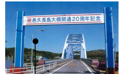
人間回復の橋と呼ばれる邑久長島大橋

長島と対岸の虫明を結ぶ邑久長島大橋は、1988年(昭和63年)に開通しました。隔離する必要のない証、人間回復の証として架橋され、現在は民間バスも乗り入れ、入所者も自由に島外に出かけられるようになっています。