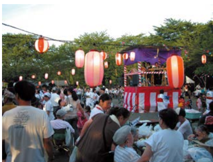
地域の人たちと交流会(多磨全生園)

私たちがこうした現実を知らなかったのは、国が国民に実態を知らせなかっただけでなく、私たちの無関心も大きな原因なのではないでしょうか。子どもたちにハンセン病問題の現実を伝え、今なお偏見や差別に苦しんでいる入所者や社会復帰者たちが置かれている現実に目を向けてほしいと思います。さらに、ハンセン病問題の解決をめざして、私たちに何ができるかを子どもたちと共に考え、行動にうつしていただければと願っています。