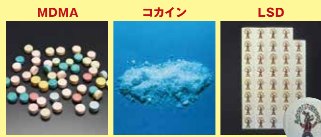
MDMA コカイン LSD 隠語: エクスタシー、バツなど 隠語: コーク、スノウなど