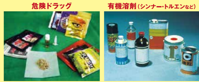
危険ドラッグ 有機溶剤(シンナー・トルエンなど) 隠語: ハーブ、アロマ、バスソルトなど