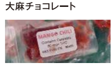
大麻クッキー 大麻チョコレート 大麻キャンディー