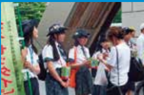
▶ 支援プロジェクトの例