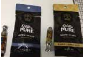
大麻ワックス 大麻リキッド

大麻を含んだ食品にも気をつけて 海外旅行のお土産として買ったりもらったものでも違法です。