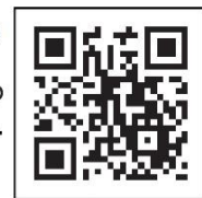
Código QR de navegación de la vacuna contra el coronavirus