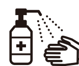
手指消毒用アルコール による消毒の励行

新型コロナワクチンの有効性・安全性などの詳しい情報については、厚生労働省ホームページの「新型コロナワクチンについて」のページをご覧ください。