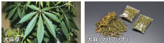
大麻草 大麻(マリファナ)

SNSなどで「大麻は害がない」などのニセの情報が広まっています。こうしたウワサを信じて大麻に手を出し、検挙される人が急増しています。