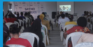
ナイジェリア: 指導者養成講習会の風景