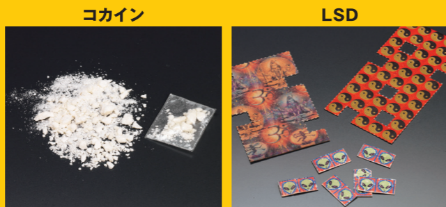
コカイン 隠語：コーク、スノウなど LSD