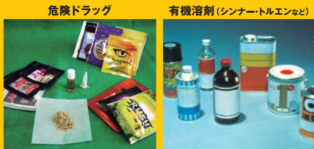
危険ドラッグ 隠語：ハーブ、アロマ、バスソルトなど 有機溶剤 (シンナー・トルエンなど)