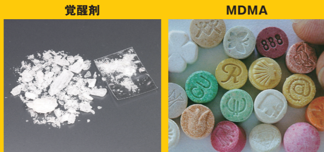
覚醒剤 隠語：スピード、エス、アイスなど MDMA 隠語：エクスタシー、バツなど