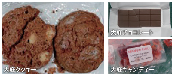
大麻クッキー 大麻チョコレート 大麻キャンディー