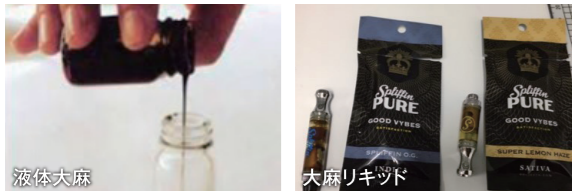
液体大麻 大麻リキッド