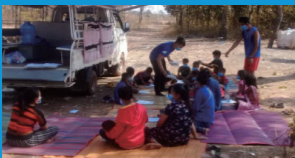
ラオス: モバイルスクールバスでの薬物乱用防止活動