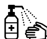
手指消毒用アルコール による消毒の励行

新型コロナワクチンの有効性・安全性などの詳しい情報については、厚生労働省ホームページの「新型コロナワクチンについて」のページをご覧ください。