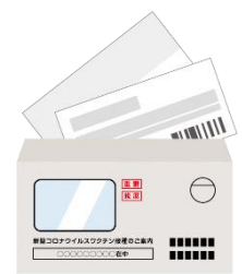
Berkas dokumen dalam amplop