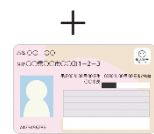
Kartu My Number, dll.