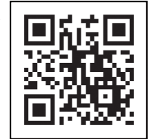
ကိုရိုနာဗိုင်းရပ်စ် ကာကွယ်ဆေး လမ်းညွှန် နှစ်ဖက်မြင်ဘားကုတ်ဒ်

ကိုရိုနာဗိုင်းရပ်စ်ကာကွယ်ဆေး လမ်းညွှန်ဝက်ဘ်ဆိုက်လိပ်စာ: https://v-sys.mhlw.go.jp