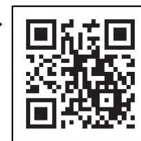
Двумерный штрихкод вакцины от коронавируса

*Записаться на приём на вакцинацию непосредственно на сайте вакцины от коронавируса невозможно.