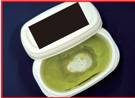
Mantequilla de cannabis