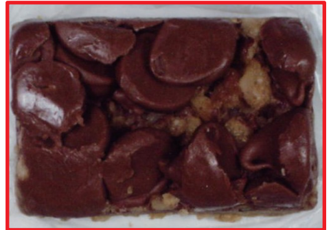
Pastel de cannabis