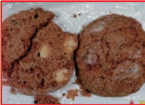
Galletas de cannabis