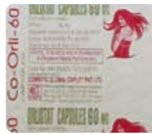
偽造医薬品見本（瘦身薬）

厚生労働省が、インターネット上で販売されている「海外製医薬品」と称する製品を購入・分析した結果、表示と異なる成分を含む「粗悪品」や「ニセモノ」の製品が数多く見つかっています。これらを使用すると重大な健康被害が生じるおそれがありますが、その場合は 患者の救済を図る公的な制度（医薬品副作用被害救済制度）の対象になりません のでご注意ください。詳しくは下記ホームページをご覧ください。