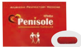
強壮サプリメント製品

2021年、海外から強壮サプリメント製品を個人輸入して服用した方が、腹痛、手の震え、吐き気、頭痛の症状により医療機関を受診。医師から鉛中毒と診断され、服用していた強壮サプリメント製品からは鉛以外にも「アシュワガンダ」「ヒヨス」といった医薬品成分が検出されました。