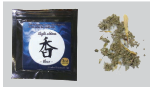
▲危険ドラッグ(ハーブ系)

規制が強化され販売ルートも限定的になりましたが、覚醒剤や大麻に似た成分が含まれていることもある大変危険な薬物です。