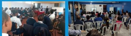
ケニア：キャンプの学校で行われた 薬物乱用防止の授業 ベラルー：タラボトの高校生対象の薬物乱用防止教室