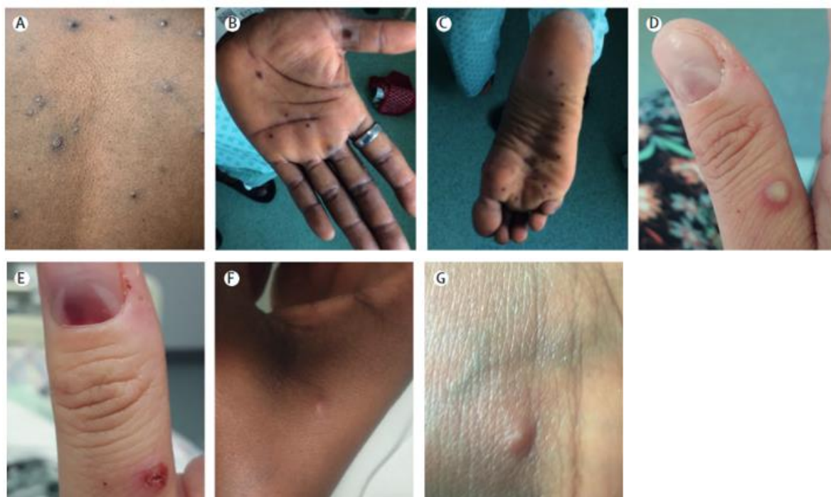
A : 小水疱、B, C : 手掌、足底の斑点状の皮疹、D : 膿疱と爪下病変、E : 爪下病変、F, G : 小丘疹、小水疱 (文献 1)

顔面 (95%)、手掌、足底 (75%) に好発する。発疹の経過は 10 日程度で、斑点状→小水疱→膿疱→痂皮と経過をたどる。発疹が多く発生する部位として、多い順に、顔 > 脚 > 体幹 > 腕 > 手掌 > 生殖器 > 足底が挙げられる 1 。口腔粘膜や結膜、角膜にも発症した例が報告されている。痂皮は 3 週間は完全に消失しないことがあり、結痂 (けつか) が乾燥して痂皮になり、剥がれ落ちると感染力はなくなる 2 。