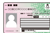
マイナンバーカード 等