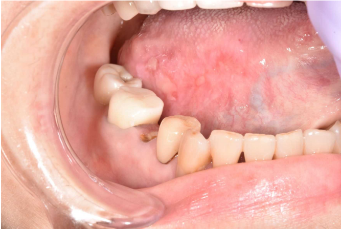
図 1 PCE (パクリタキセル・カルボプラチン・セツキシマブ) 療法による舌炎。