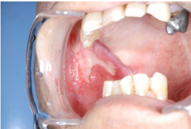
図 4 S-1 による口腔粘膜炎