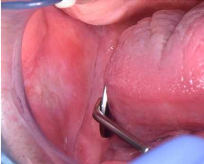
図 3 ペムブロリズマブによる口腔粘膜炎。