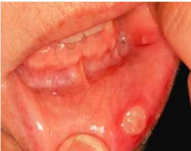
図 6 エベロリムス (mTOR 阻害薬) による口内炎