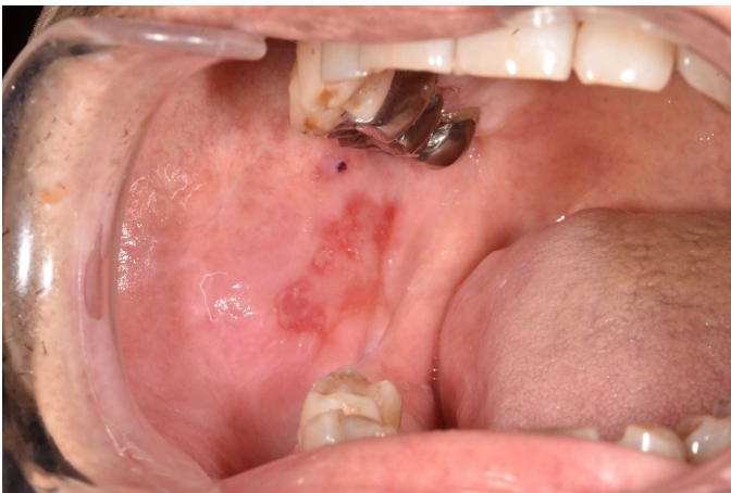
図 2 ニボルマブによる口腔粘膜炎。