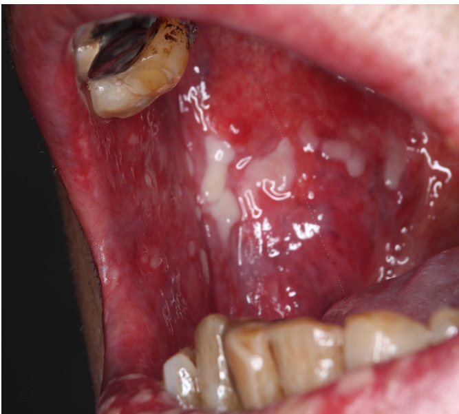
図 8 FP(5-FU+シスプラチン) 併用療法による口内炎