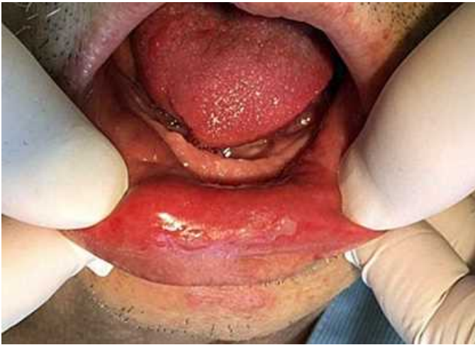
図 5 TPF(ドセタキセル・シスプラチン・フルオロウラシル)療法による口内炎