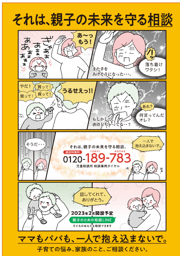
A4 リーフレット (表)

「児童虐待防止推進月間」に向けたポスター・リーフレット・動画を公開し、地方自治体、NPO等民間団体、民間企業における活用を啓発します。なお、全国地方自治体には、10月末迄に印刷物を順次配布します。