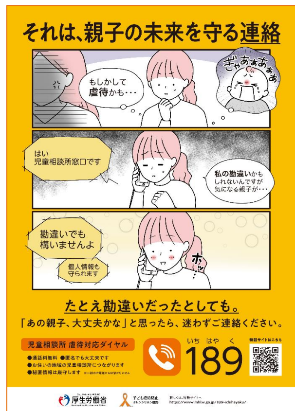
A4 リーフレット (裏)