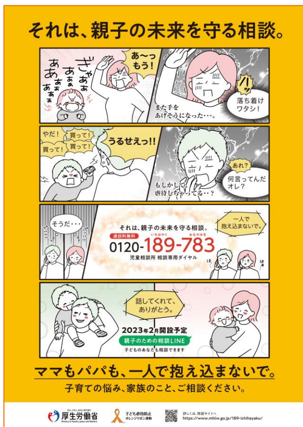
A3・A4 ポスター 共通

【厚生労働省】児童相談所 相談専用ダイヤル 「0120-189-783」 (いちはやくおなやみを)