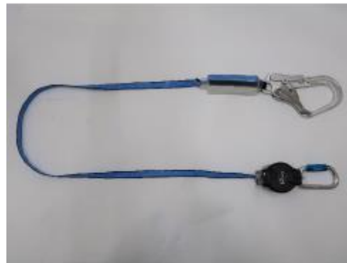
ランヤード全体 (巻取器からストラップを全て出した状態)