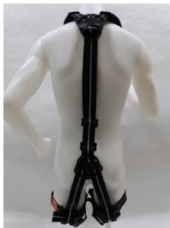
フルハーネス全体（後側）