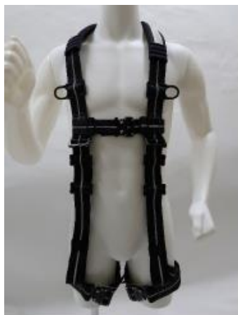
フルハーネス全体（前側）