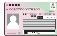
マイナンバーカード 等